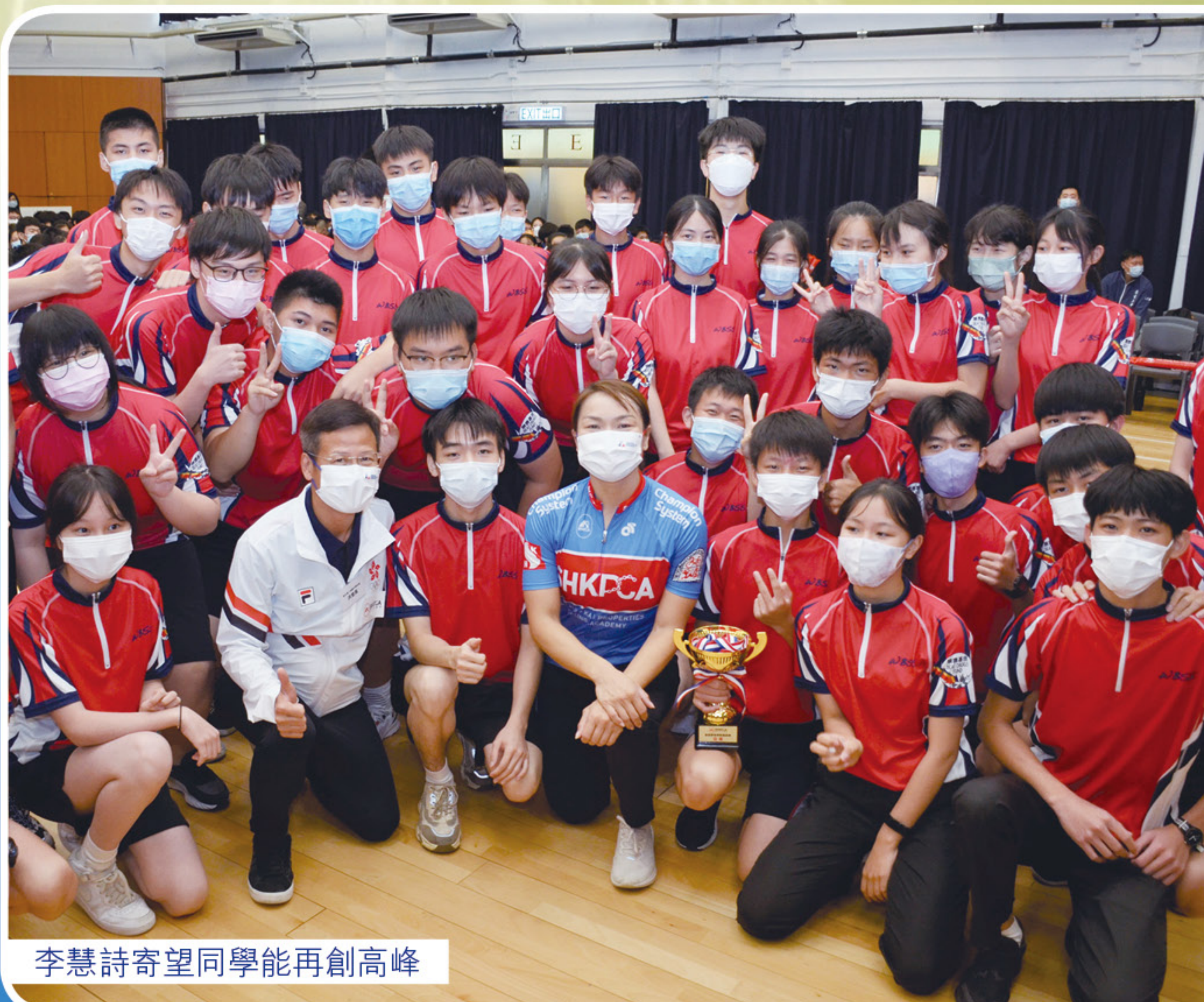
李慧詩寄望同學能再創高峰

校長：「沒有奇蹟，要有成績，只有累積」，只要心沒有放棄，身體就會跟隨，同學加油！