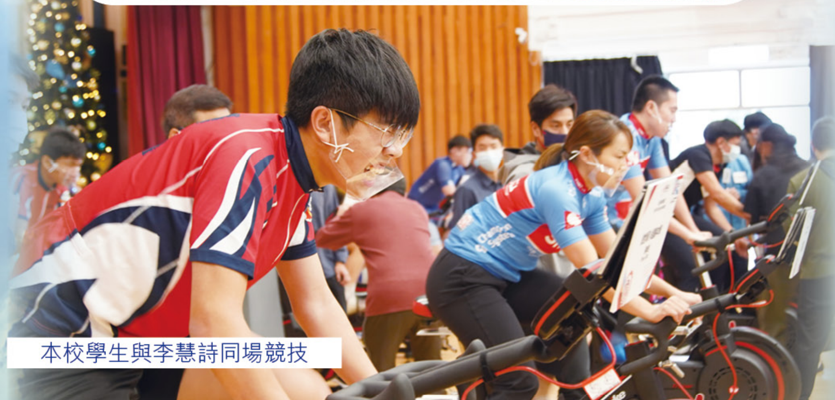
本校學生與李慧詩同場競技