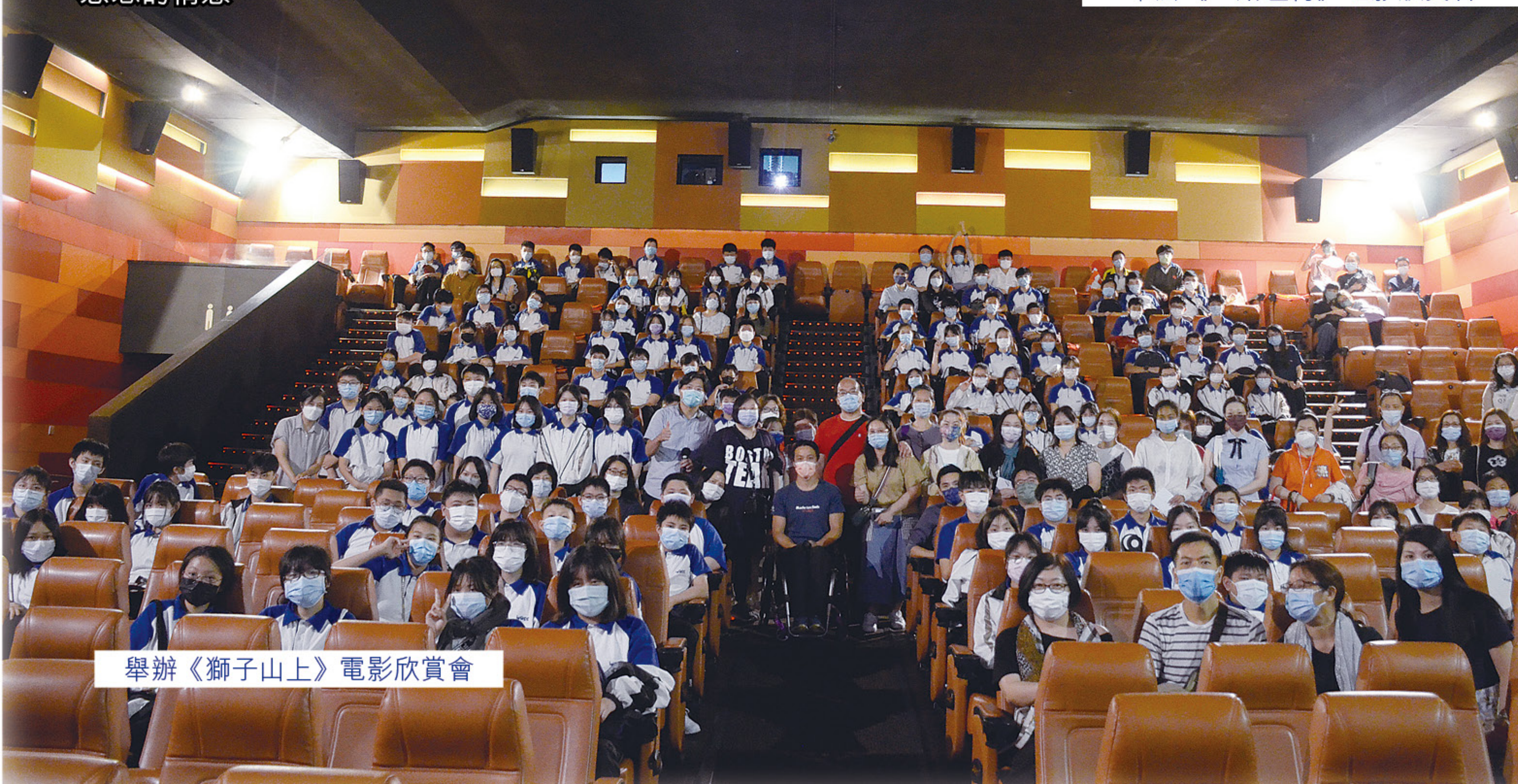
舉辦《獅子山上》電影欣賞會