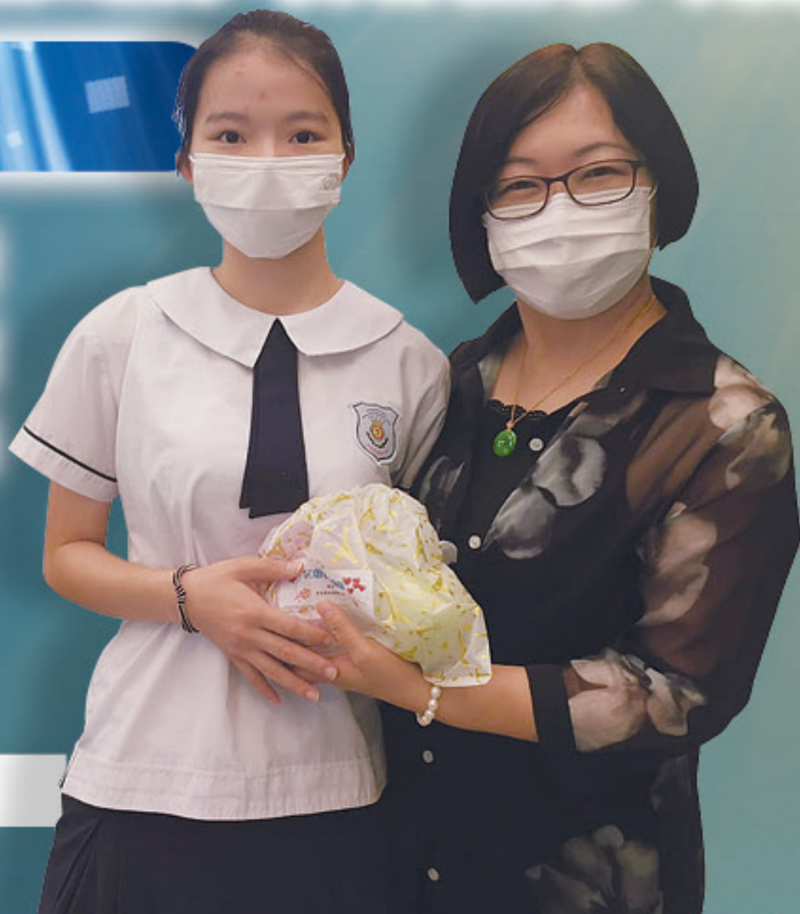
家長們送學生水果以表支持

家教會支持敬師週多年，答謝教師在疫情下緊守學生崗位，持續關心學生。家教會精選水果送贈學生與家長，為大家打氣加油。