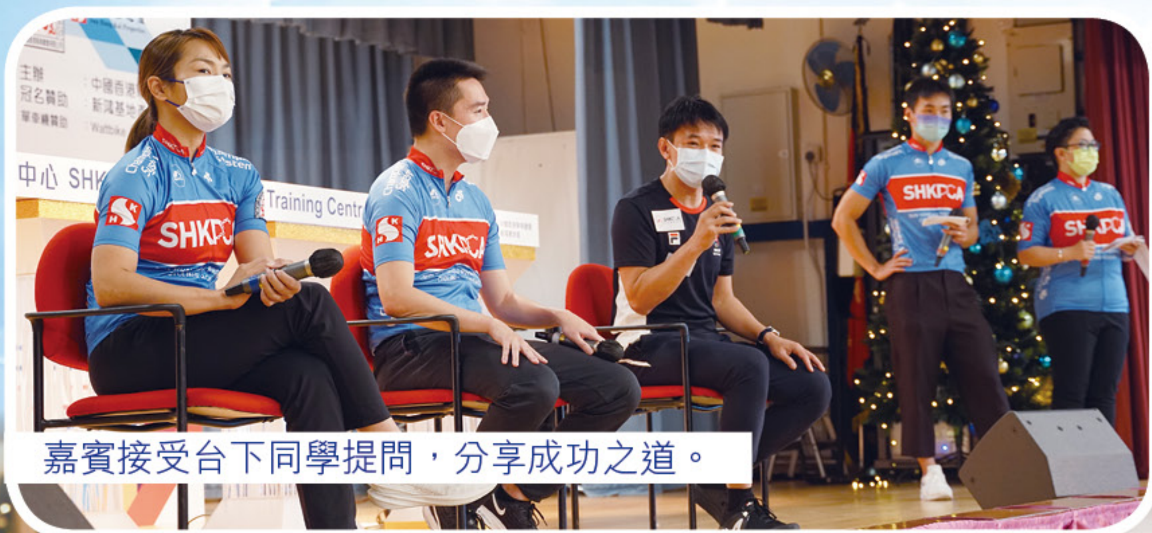
嘉賓接受台下同學提問，分享成功之道。