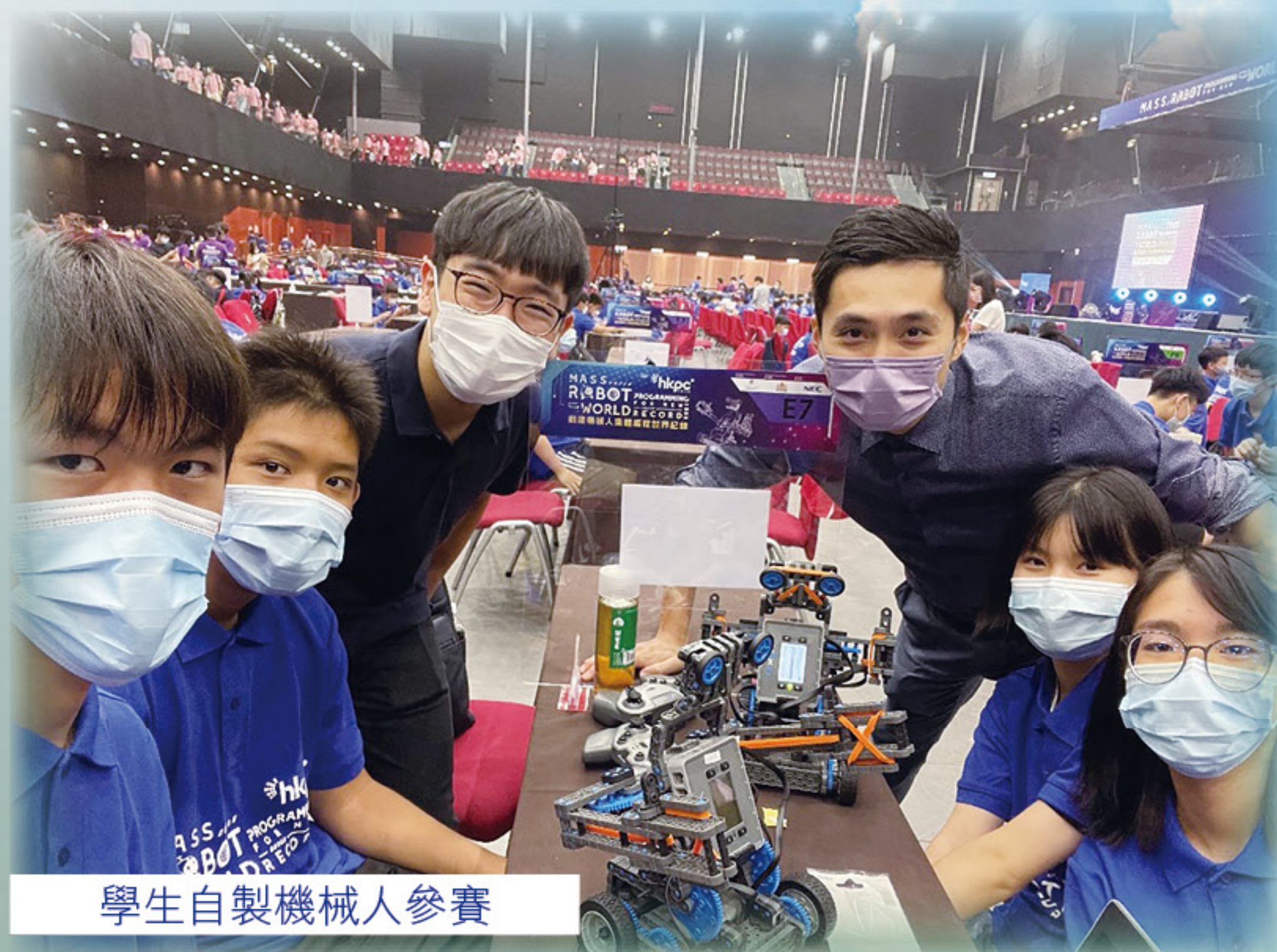
學生自製機械人參賽