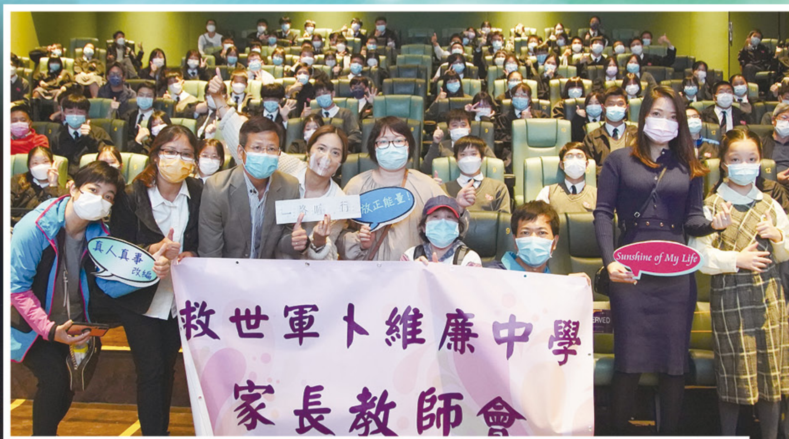
舉辦《一路瞳行》電影欣賞會