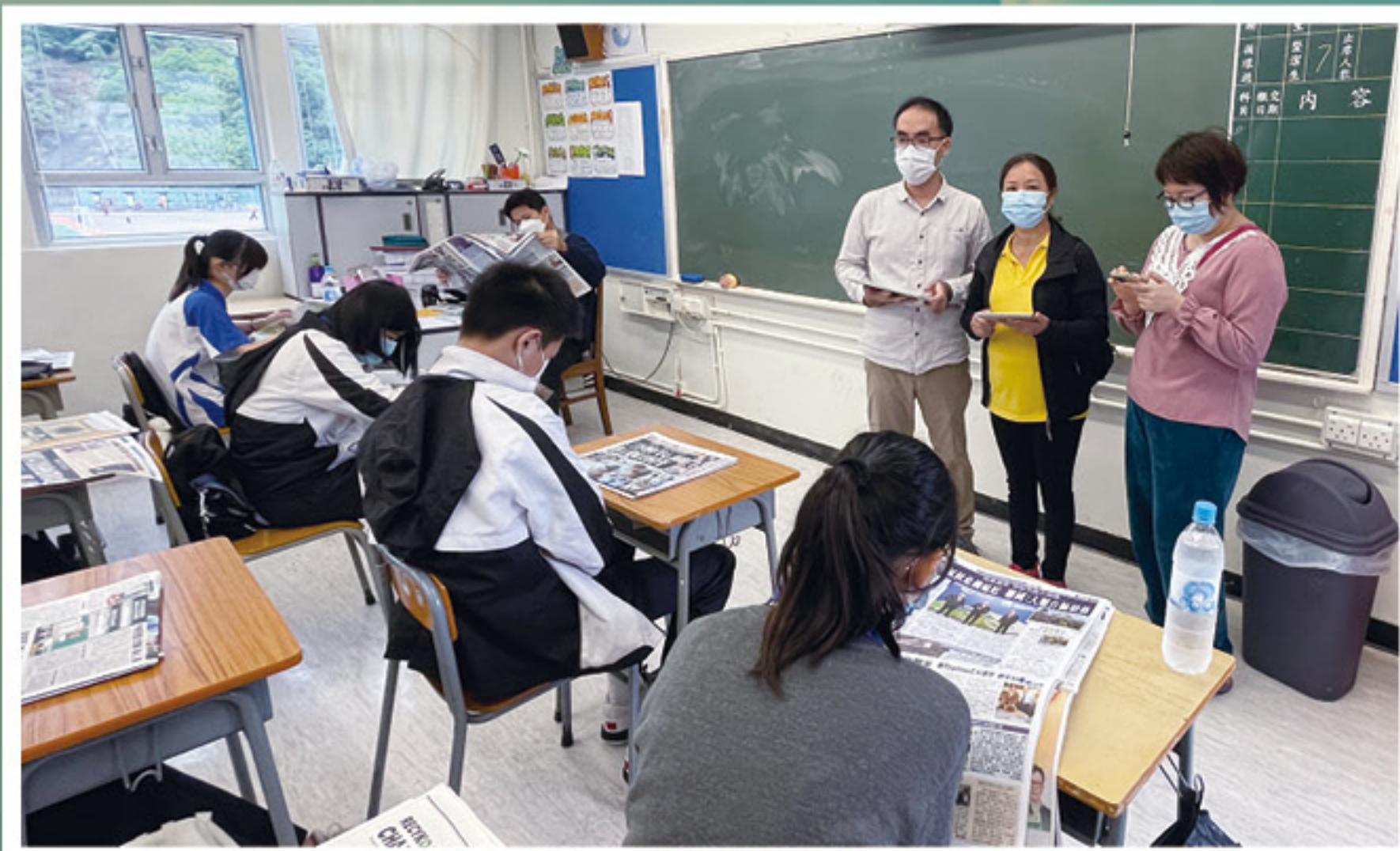
家長參與閱讀活動，選出最投入閱讀的班別。

學校為了培養學生閱讀習慣，設有晨讀時段，鼓勵師生共同閱讀。本會獲邀共同參與其中，一起見證全校性閱讀活動。