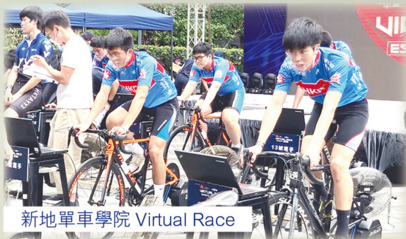
新地單車學院 Virtual Race