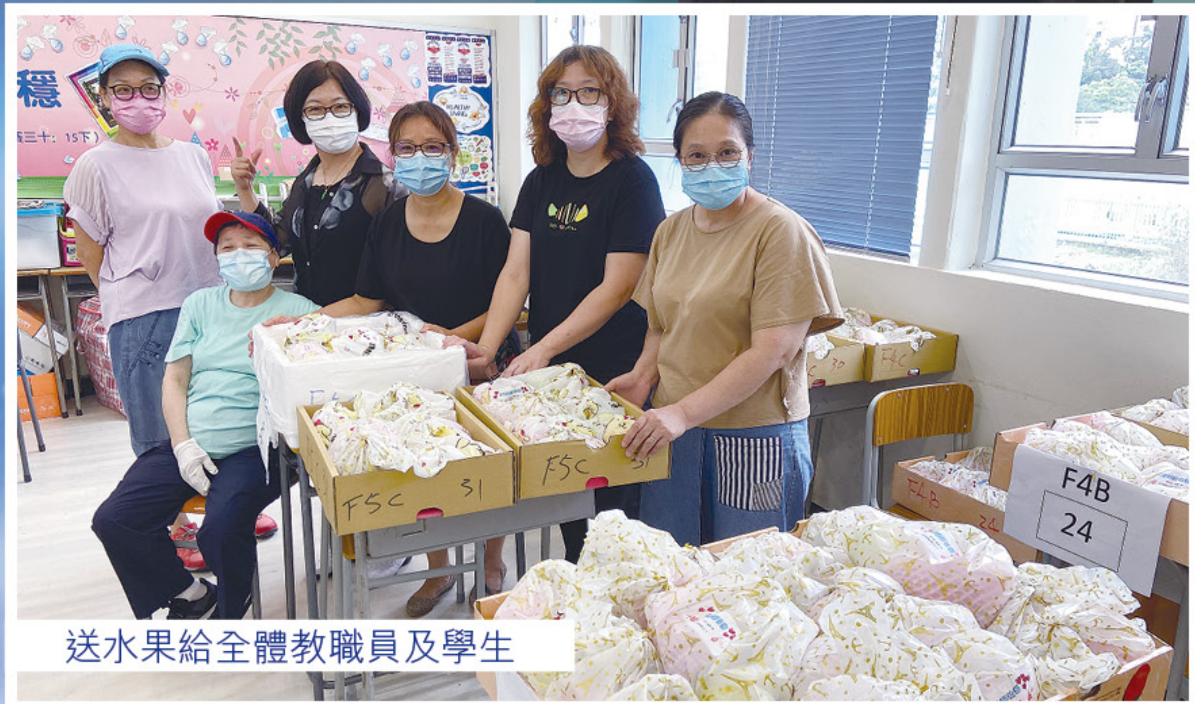
送水果給全體教職員及學生