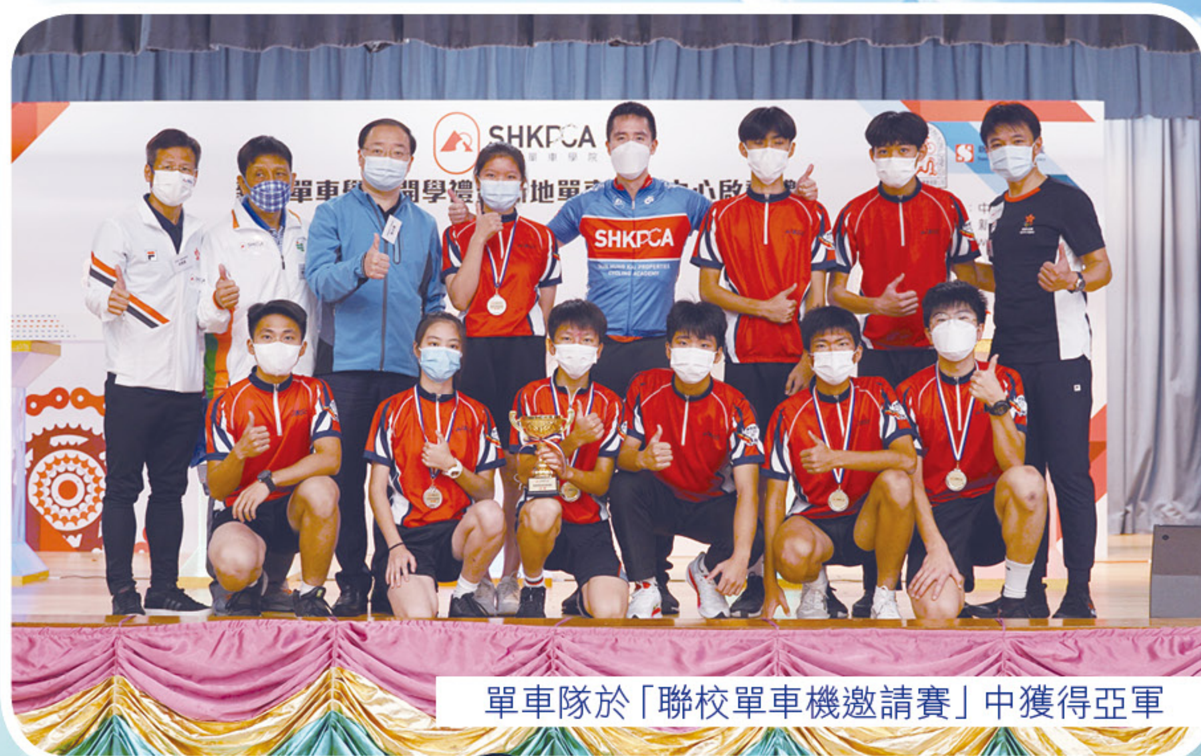
單車隊於「聯校單車機邀請賽」中獲得亞軍

洪校長指出作為是次活動主辦場地，有幸讓全校師生一同與兩名世界冠軍交流、一睹兩位風采及聆聽他們經驗分享，相信能激勵學生的鬥志。他亦感謝李慧詩及黃金寶借出「彩虹戰衣」及單車。