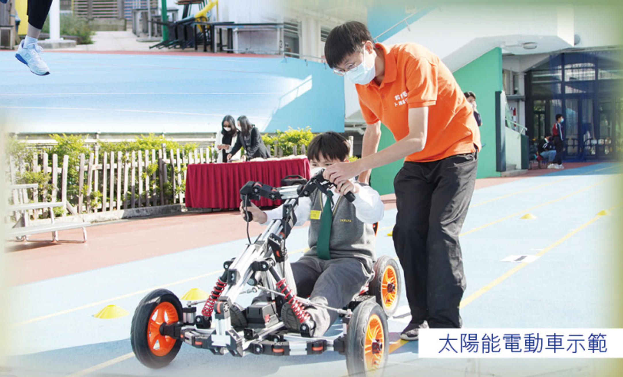
太陽能電動車示範