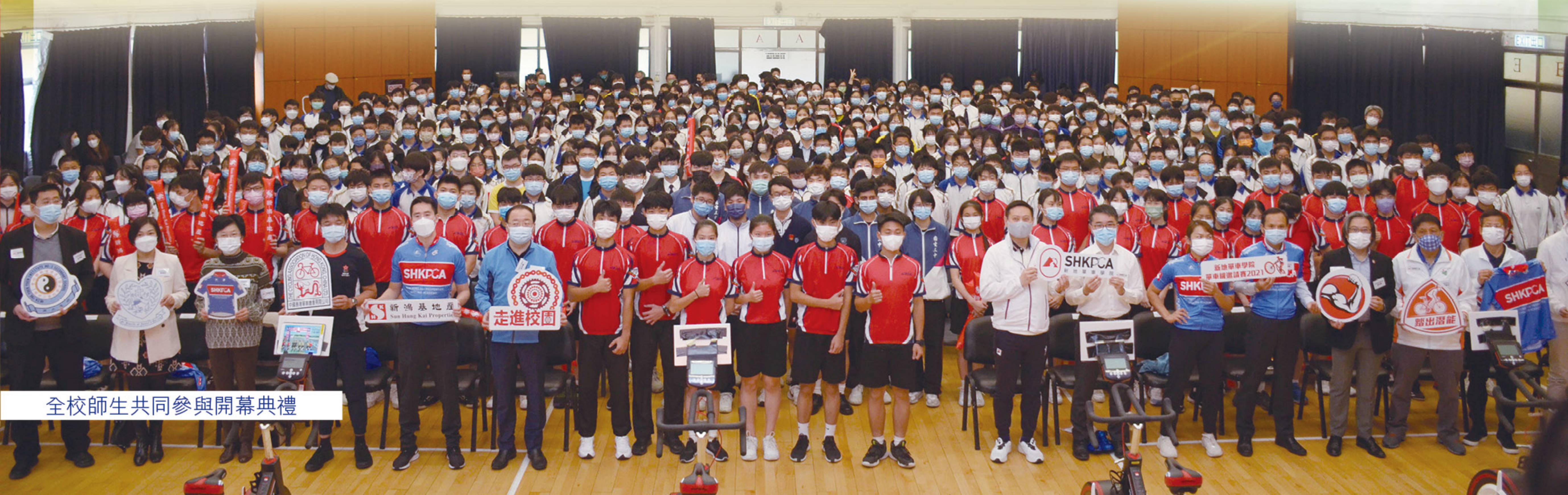
全校師生共同參與開幕典禮

答：在交流環節中，兩位前輩對我們的鼓勵我會時刻謹記，保持拼勁。來年將離開校園了，雖然未必主力在單車運動中發展，然而我也會把我在訓練過程中學到的堅毅、勇敢用在追尋夢想上。