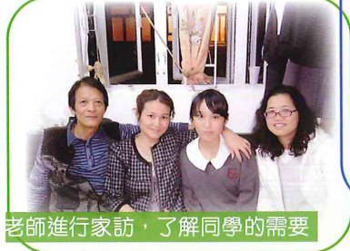
老師進行家訪，了解同學的需要