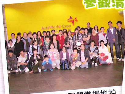
在動畫清明上河圖觀賞場地拍照留念