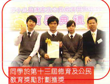
第十三屆德育及公民教育獎勵計劃頒獎典禮