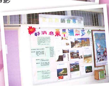
親子旅遊宣傳壁佈