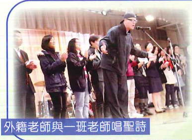
外籍老師與一班老師唱聖詩