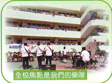
全校焦點是我們的樂隊