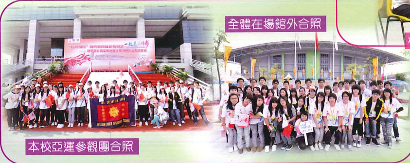
本校亞運參觀團合照