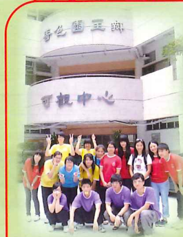
初中同學到可觀自然教育中心暨天文館參觀