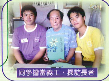
同學擔當義工，探訪長者