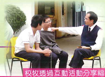
校牧透過互動活動分享福音