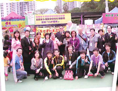
大家都來支持家長教師會