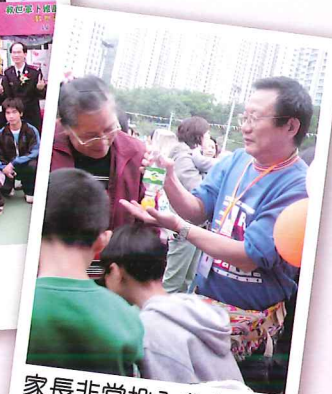
家長非常投入參與活動