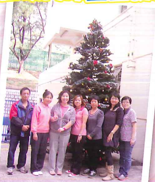
完成佈置·拍照留念