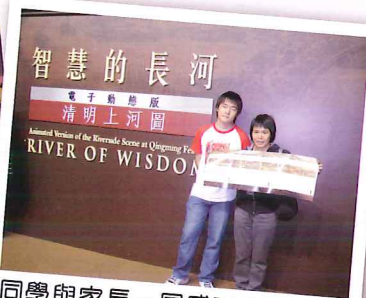
同學與家長一同感受中國文化