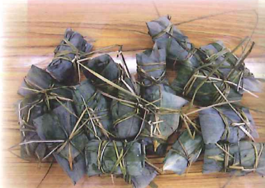
學生有成果，好滿足。