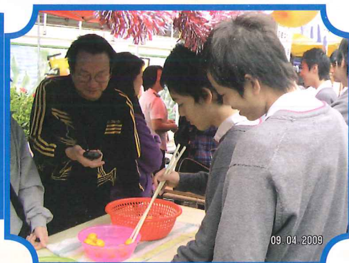
計時：夾的速度要快而數量要多。