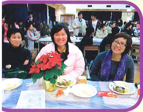
我們都得到聖誕花。