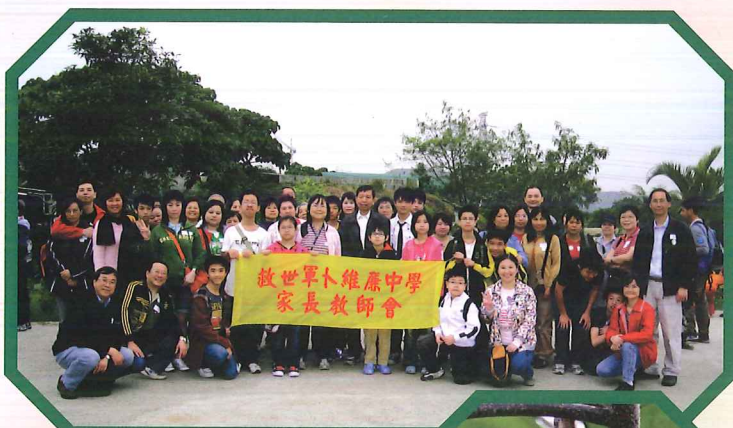
攝於塋原濕地農莊的大合照。