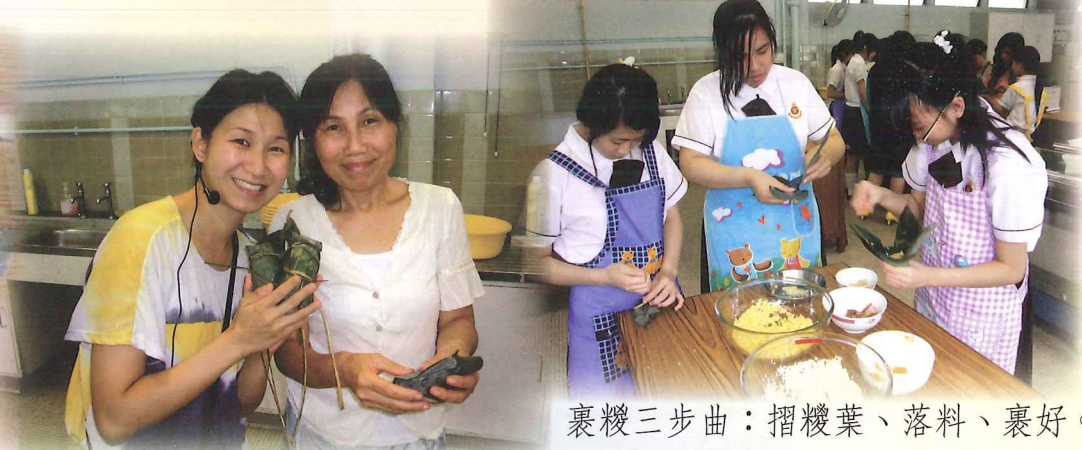
裹糉三步曲：摺糉葉、落料、裹好。