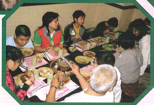
吃多少，拿多少，不要浪費食物。