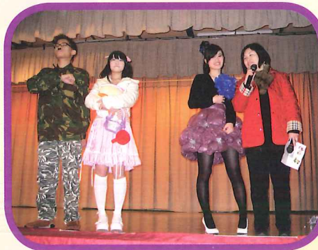
環保少女的裙是塑膠袋做的。