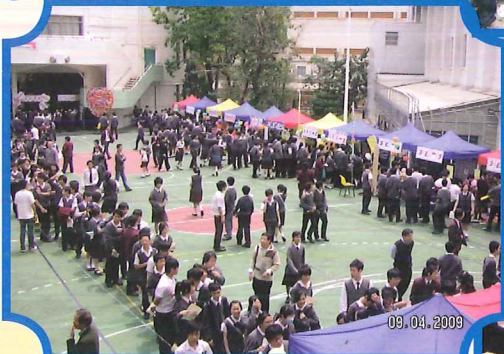
大家有目標、有方向。