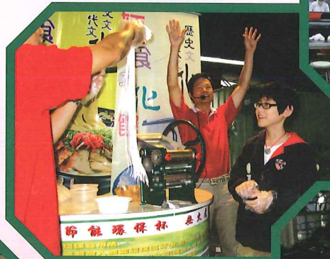
麵片已切開一條一條，成功了。