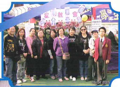
攤位工作人員合照。