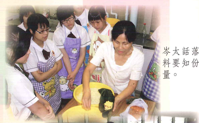
岑太話落料要知份量。