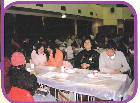
研究那個化妝造型比較好。