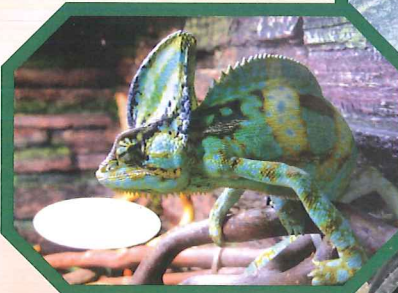
攝於塋原濕地農莊的大合照。