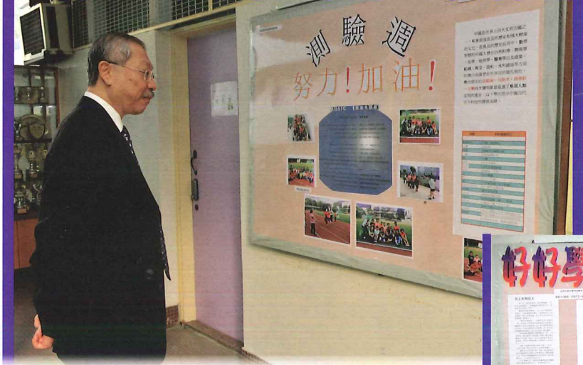
局長觀看家長教師會壁報。