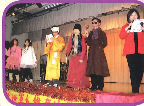
智者和福爾摩斯勝出。