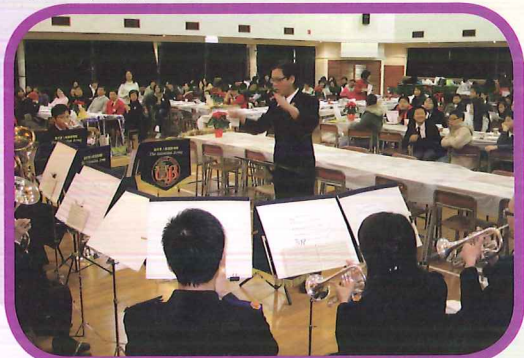
禮堂洋溢聖誕氣氛。