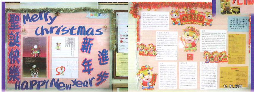
新曆年、農曆年同樣重視。