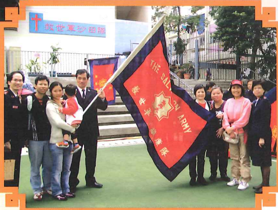
救世軍軍 官與家長 留影。