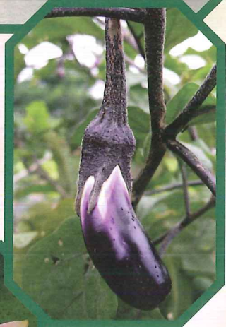
愛護並欣賞大自然生物。