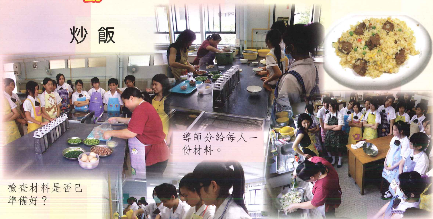
導師分給每人一份材料。