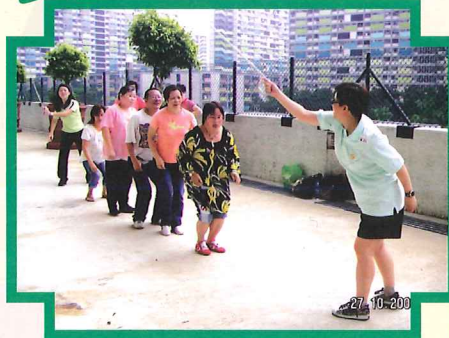
加緊練習，準備比賽。