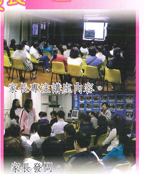
家長專注講座內容。