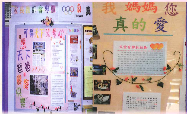
讓父母感受你對他們的愛。