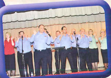
唱詩班表演真是拍案叫絕

著名悉尼唱詩班合唱團於十月十五日下午到本校為師生表演多首耳熟能詳的優美詩歌。全團十多人發揮幽默本色，以逗趣方式與全校作互動，歡笑之聲洋溢整個禮堂。之後，更用英語與本校學生交流學習心得。部份團員更與本校排球隊及校長進行排球友誼賽。