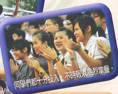
同學們都十分投入，不時報以熱烈掌聲。