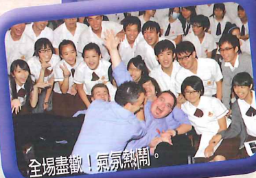
全場盡歡，氣氛熱鬧。