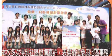
本校多次得到社區機構嘉許，表揚積極參與地區事務。