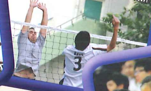
放學時間，唱詩班與本校進行一場排球友誼賽。