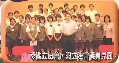
參觀立法會，與立法會議員見面。