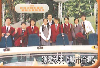
獲邀參與《城市論壇》