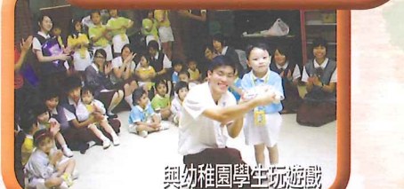
與幼稚園學生玩遊戲