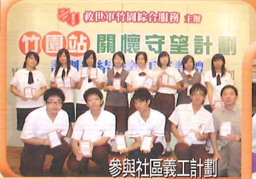
參與社區義工計劃

本校近年積極推行及鼓勵學生參與社會事務。與社區義工團體籌辦不同義工服務，期望學生學懂關懷別人，尤其弱勢社群。